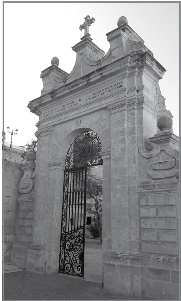
L-Ark Trijonfali fid-daħla għall-bitha tas-Santwarju

F'Malta fi żmien il-Kavallieri ta' San Ġwann, inbnew għadd ta' arki trijonfali, ngħidu aħna, ta' Wignacourt (1615), De Rohan (1798) u Hompesch (1801). L-ewwel ark inbena bħala tifikira tal-akwadott u t-tnejn l-oħra biex ifakkru t-twaqqif tal-ibliet ta' Ħaż-Żebbuġ u Ħaż-Żabbar mill-gran mastri msemmija rispettivi. Ftit wara l-bini tal-ark tal-bitha tas-Santwarju, fl-1720-21 inbena dak li illum nafuh 'Bieb il-Bombi' u li dak iż-żmien kien jissejjah Porta dei Cannoni . Bieb il-Bombi ma kienx ark trijonfali kif jidher illum u kien fih biss mina waħda. Kien jiffirma parti mis-Swar tal-