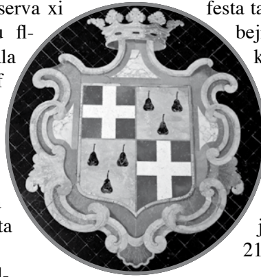
L-arma tal-Gran Mastru Ramon Perellos Y Rocaful

u fis-26 ta' Meju 1719, l-Isqof Ġakbu Cannaves ħareġ editt lill-knejjes kollha li fih appella biex issir gabra b'risq it-tkabbir tas-Santwarju u biex issir pjanura quddiemu. Il-għbir fil-knejjes għal dan il-għan sar xi ġimgha wara. 11