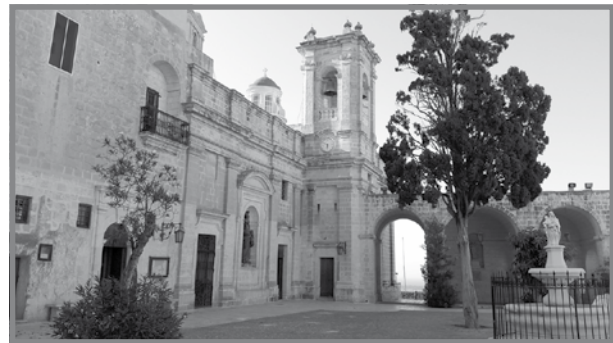
Is-Santwarju Nazzjonali tal-Madonna tal-Mellieħa

Mal-għbir imsemmi, sors ewlieni ta' dhul, li għen biex jithallsu l-ispejjeż tax-xogħol li sar lis-Santwarju u l-binjiet ta' madwaru kienu d-diversi donazzjonijiet oħra li taw kavallieri u kaptani ta' xwieni u iġfna tal-Ordni u tal-kursara Maltin. Fl-1700 il-Gran Mastru Perellos irriforma l-flotta tal-Ordni. Minn tmien xwieni, il-flotta tal-Ordni niżżilha għal ħamsa u magħha holoq skwadra oħra ta' erba' vaxxelli. Ir-riforma tat il-frott għax permezz tal-ħbit bil-vaxxelli u bċejjeċ tal-baħar oħra nqabdu għadd ta' prejjeż, fosthom frejgati, vaxxelli, tartani u bastimenti oħra tal-gwerra u merkantili, l-aktar Tuneżini, Alġerini u Torok 12 , u minn dan il-ġid ibbenifikaw bosta opri artistiki, binjiet militari u postijiet religjużi bħas-Santwarju tal-Madonna tal-Mellieħa.